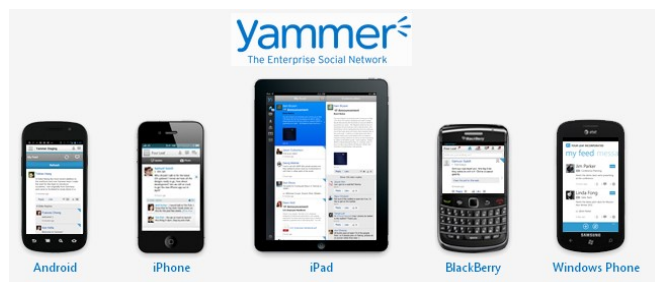
Figur 2. Yammer kan benyttes fra alle gængse mobile platforme

Yammer er tilgængeligt for alle platforme, via en app til iPhone, iPad, Windows Phone, Android eller webbrowser, jf. figur 2..